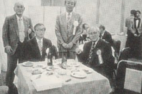
左から ●古賀支部長 ●徐賢婁総領事 ●津坂伸幸農学部部長 ●緒方副支部長