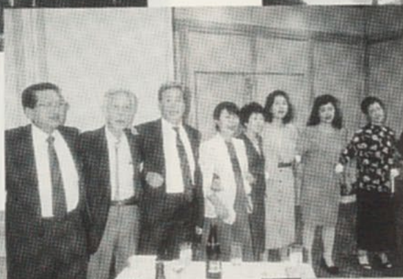
●父母会の方も一緒に肩を組み校歌