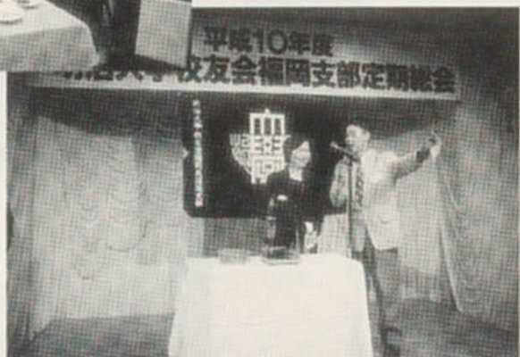
●父母会の協力をいただき抽選会