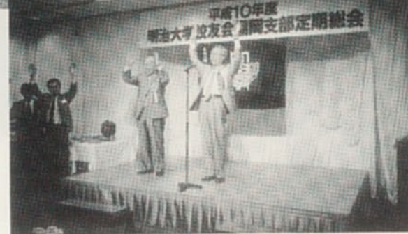
●明治大学万歳 校友会万歳