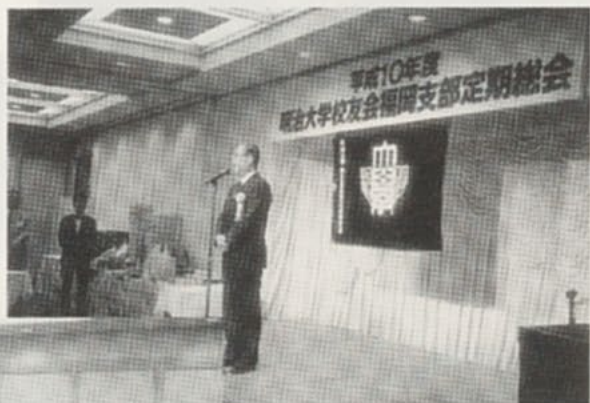
●桑名小倉支部幹事長挨拶