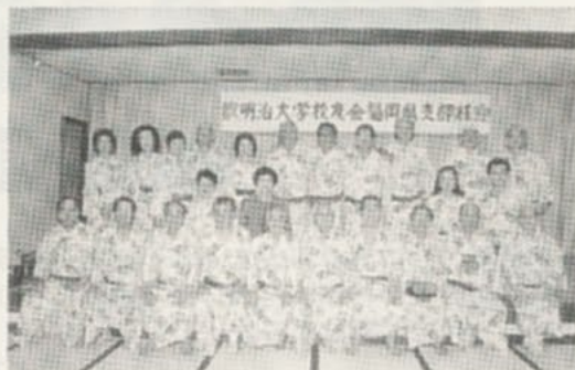
明治大学校友会全国大会