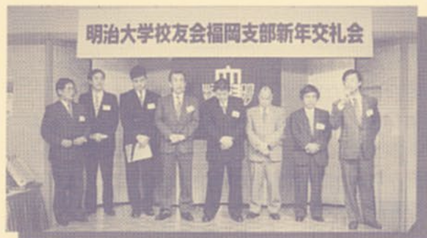
▲新人校友自己紹介