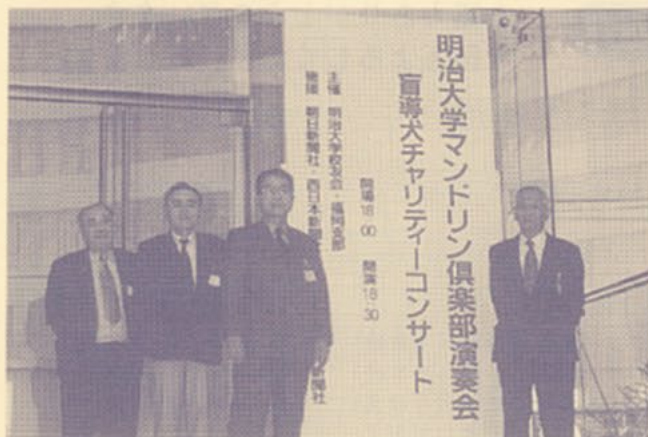
▲盲導犬チャリティーコンサートで開催