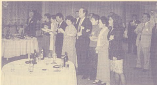
▲小石原校友の音頭で父母の方も校歌を斉唱

東会長は退任の挨拶の中で、大学・校友会・父母会の3者が連携し就職のサポート等や意見交換の場を