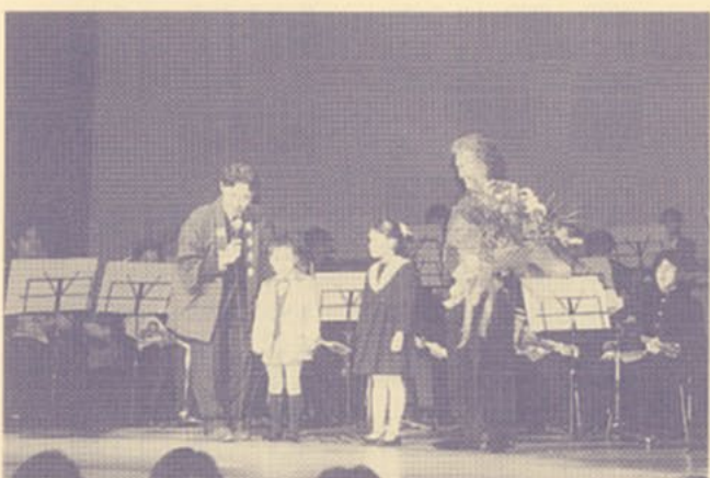
▲ゲストの菅原洋一氏に花束贈呈