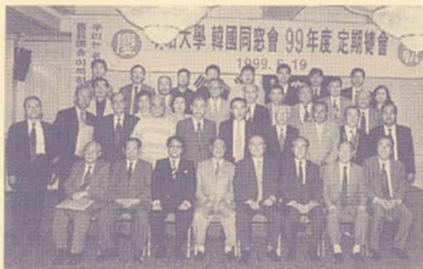
▲韓国同窓会の方々と記念撮影

2日目ホテルを8時集合し百済最後の砦で1000年の歴史をもつ「扶余」観光に出発しました。3時間半の