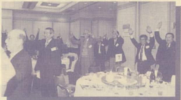
▲大学・校友会 万歳