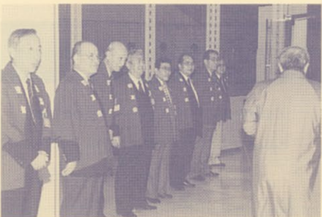
▲満足のお客様をお見送りする実行委員会の面々