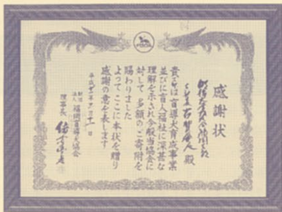
福岡盲導犬協会より立派な感謝状をいただきました。