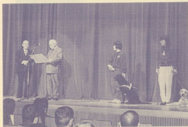
▲福岡盲導犬協会より感謝状をうける