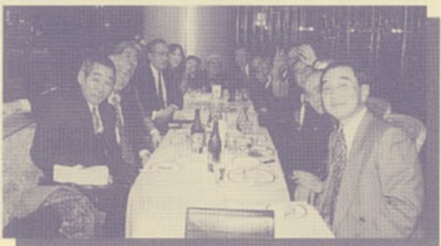
▲話がはずみ2次会へ