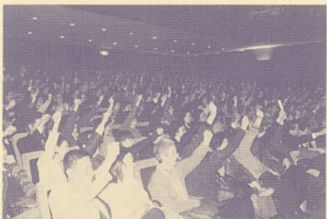
▲観客の皆様にも参加していただきました