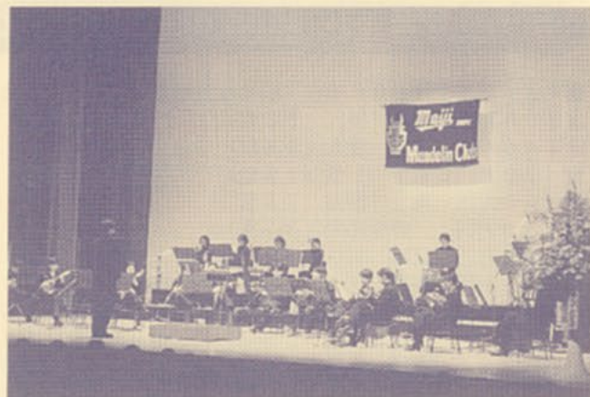
▲オープニング演奏