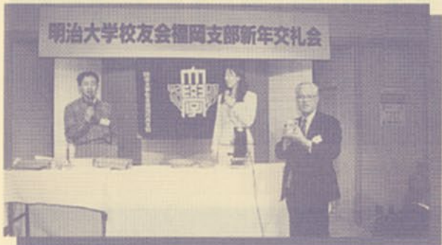
▲全員に当たる抽選会