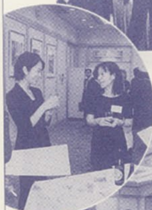
◀徐々に女性の出席も ふえています