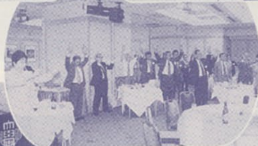
◀大学万歳・校友会万歳