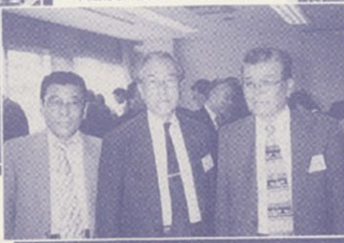
▼代議員大会に出席され(右)