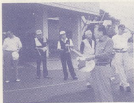
▲ゴルフ会もお世話になりました(中央)