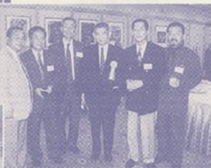
▲山崎大牟田支部長と県内支部の皆様