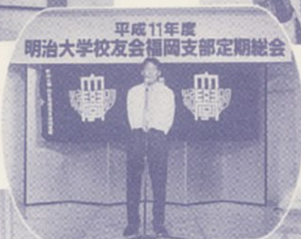
平成11年度 明治大学校友会福岡支部定期総会