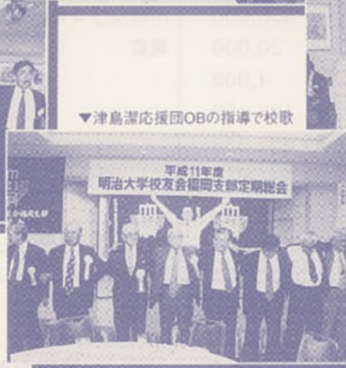
▼津島満応援団OBの指導で校歌