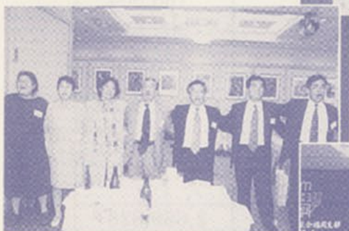
▲父母会の方々と肩を組んで校歌