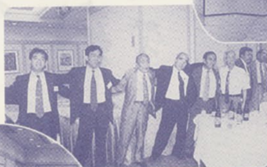
アビスパ福岡の塚本校友も 出席、挨拶