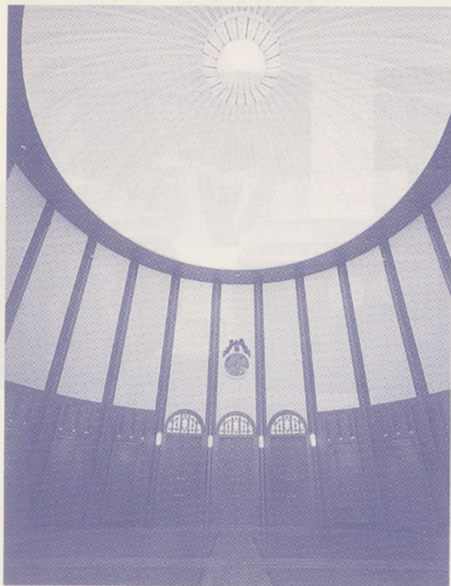
リバティタワー最上部 岸本辰雄記念ホール (23階) 展望のよい最上階。大学の歴史を物語る品々を展示しています。

明治大学校友会福岡支部事務局 / 〒810-0004 福岡市中央区渡辺通4-1-2 セントラルホテルフクオカ内 TEL092-712-1212