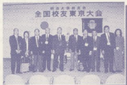
▲福岡支部の出席者記念撮影