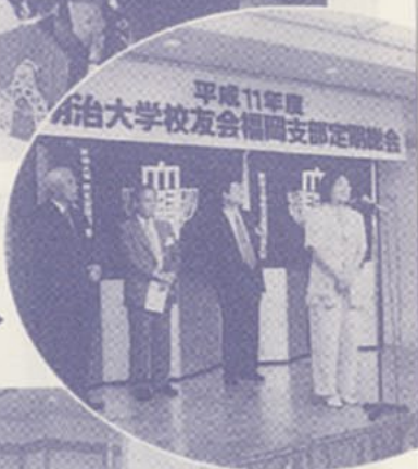
新入会員 自己紹介