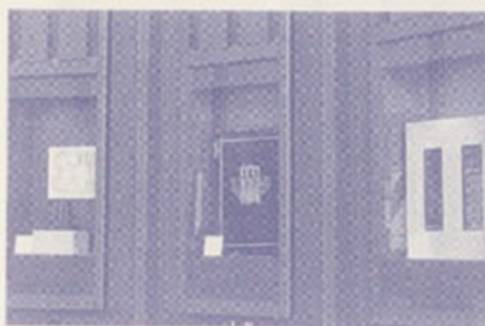
旧校門の表札、校旗 明治大学発祥記念碑 (ミニチュア)