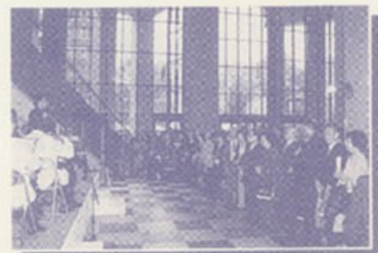
▲満員の1Fホールでの懇親会