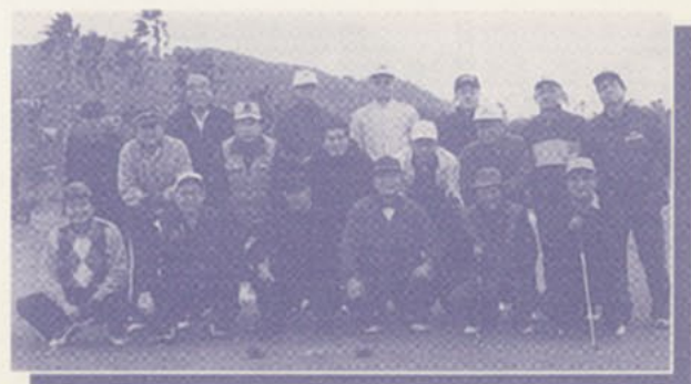
▲第16回 明福ゴルフ会 スタート前の集合写真