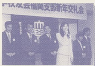
▲平成11年新年交礼会にて

平成11年の新年交礼会から参加をさせていただきました。 フラメンコの舞台衣装制作という仕事柄、独りで部屋にこもって作業をしている事が多いので、校友会の会合の出席を楽しみにしています。