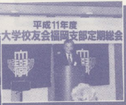
▲事務局辞任の挨拶

機能だけではなく、 快適という基準 今からのまに必要だと思う。 誰もが感じる気持ちよさ これからのいろんなところで カタチにしていきたい。