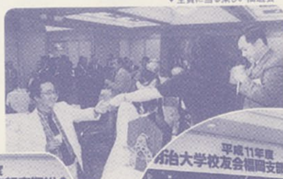
▼全員に当たる楽しい抽選会