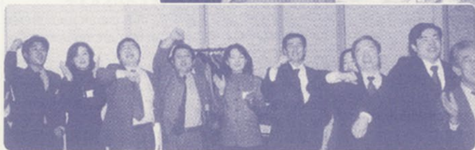
◀ 声高らかに校歌を斉唱する校友。