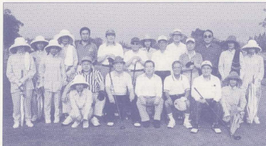
2001.2.9 明福ゴルフ会 バンコックゴルフツアー