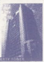
セントラルホテル