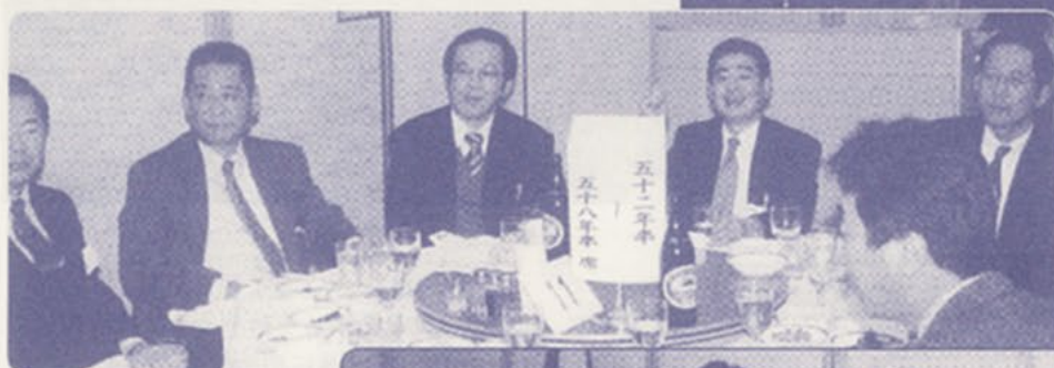
◀ 昭和52年～58年卒のテーブル。