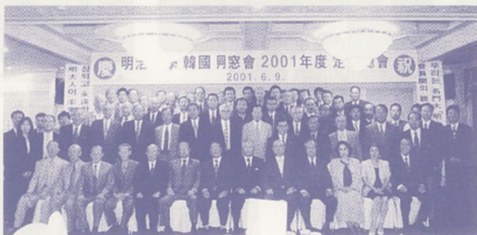
韓国の校友との記念スナップ（6月9日、於：韓国同窓会定期総会）