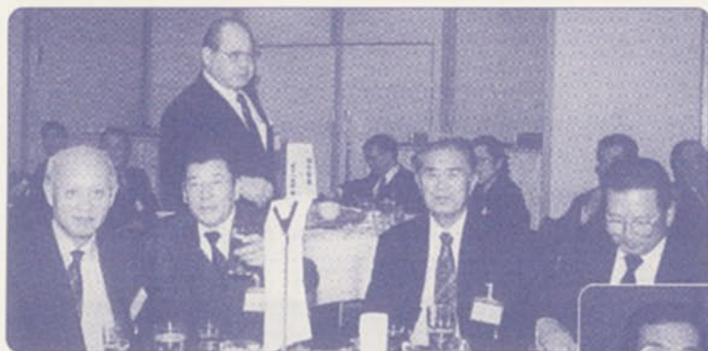
◀ 昭和30年代卒のテーブル。