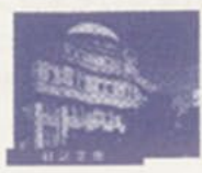
白雲をびく、緑の河

白雲のしほ、緑の河 青春のたふろ人なり 輝く時代の魂の柱 文化の源をこぼして 送げし親類の家にしよ 情結のちまたを尋ねて 結ばしめし青春の母校