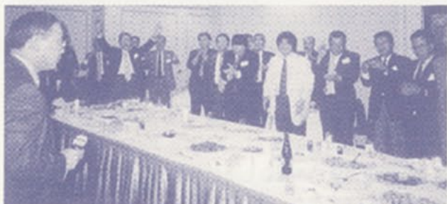
▲特別会員を交えての懇親会。