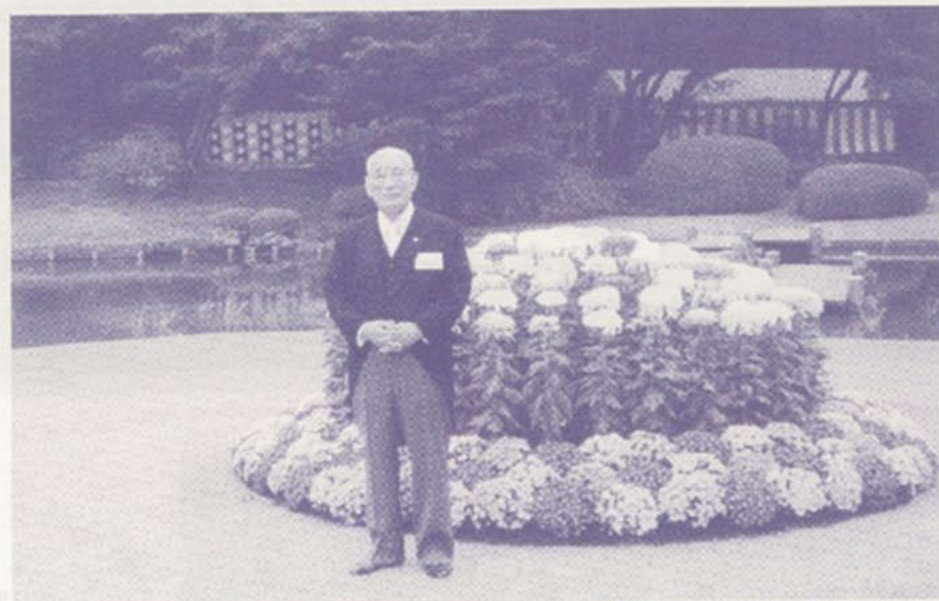
秋の園遊会に招かれ、赤坂御苑にて