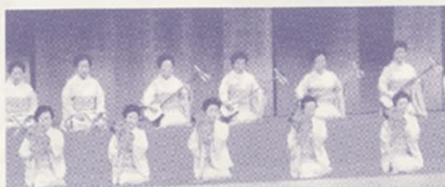
金沢三廓の芸妓連の伝統芸能

第三部、舞台の観覧が昇ると、絨毛氈の上に、二十数名の綺麗どころが勢揃い。長唄、踊、お座敷太鼓の競演と金沢三廓(ひがし茶屋街、主計町茶屋街、にし茶屋街)の芸妓連のあてやかな伝統芸能で賑やかにおひらきとなりました。