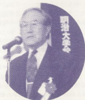
清末衰校友会副会長・小倉支部長