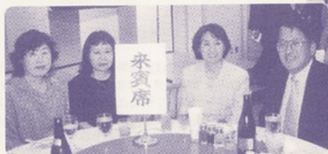
父母会役員の皆様