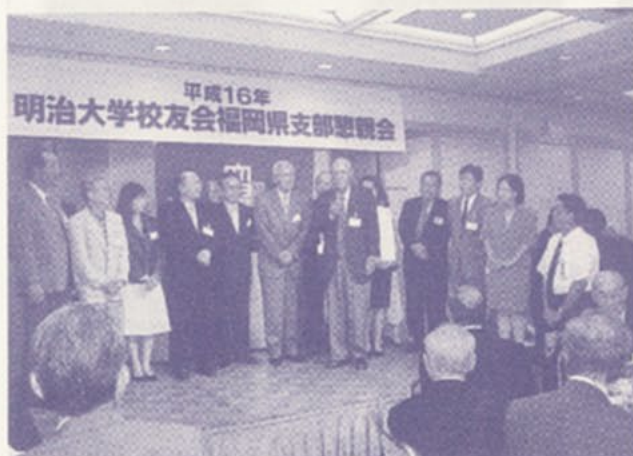
今回は多くの初参加者でした

懇親会は明治大学の長吉理事長や全国校友会の副会長のご挨拶を頂いたのち、懇親に移った。県支部総会ということで県下10の各地域支部が一堂に集まったので、各支部ごとに支部やメンバーの紹介を行った。テーブルを各年代ごとにまとめたため、支部同士の同年代の横のつながりが図られ、全国大会に向けて大変有意義な会になった。