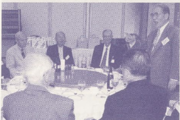
同年代で会話がはずみます