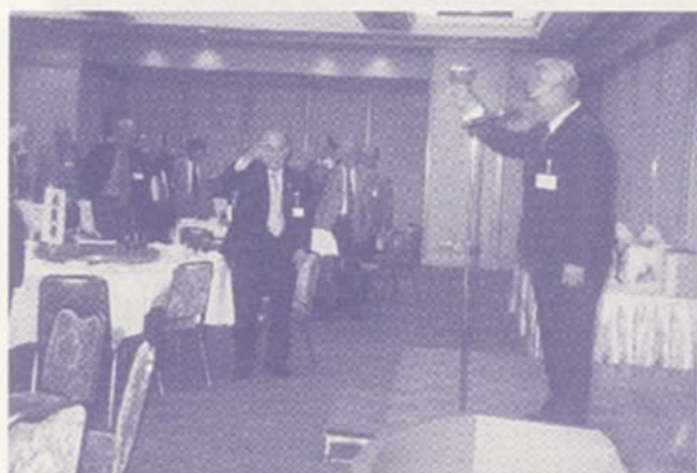
絹笠久留米支部長の乾杯