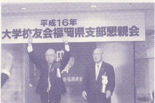
長吉理事長による、福岡県支部万歳