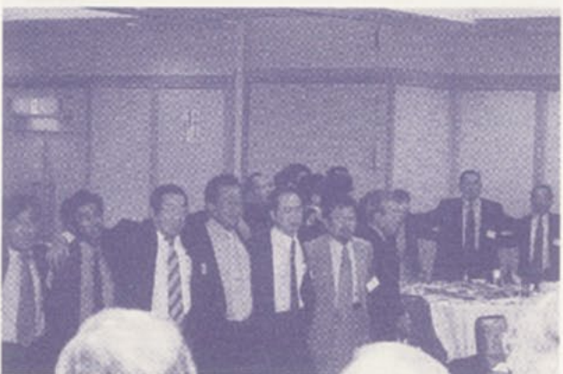
肩を組み校歌を歌う