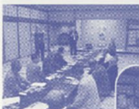
古賀支部長の講話