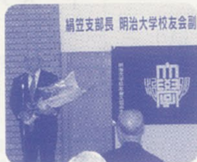
久留米地域支部主催副会長就任祝賀会にて