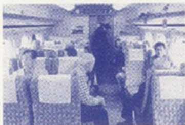
台湾新幹線の中で

しさは何物にも例えようがありません。この一瞬でこれまでの疲れが解消した思いで、素晴らしい体験でした。