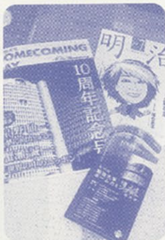
ホームカミングデーで配られたパンフレット類

次に卒業年度代表者による挨拶があり、32年はボクシングの米倉健司氏(福岡高校出身)、42年は世界的に有名なフランス菓子パティシエ 吉田菊次郎氏、52年はテレビで活躍のテレビ朝日アナウンサー渡辺宣嗣氏、62年は朝日新聞記者の松本英仁氏、平成9年は農水省主任研究官の小松 晃氏がそれぞれの仕事の中での苦労話や先輩後輩との交わり、明治との関わりなどを話されました。最後に