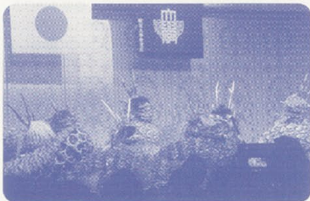
アトラクションで出された蛇踊り