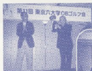
感激の優勝カップをもらう