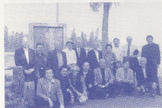
高雄の澄清湖の中の九曲橋の前で