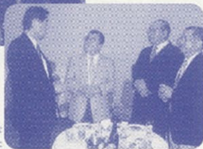
陳秘書長からいろいろな話を聞きました