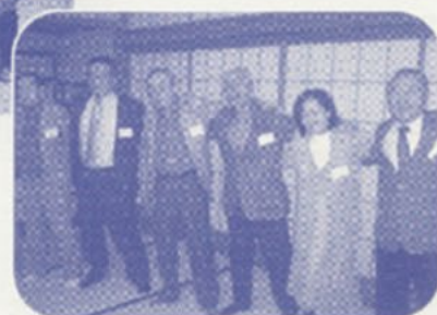
みんなで肩を組み、校歌を歌う