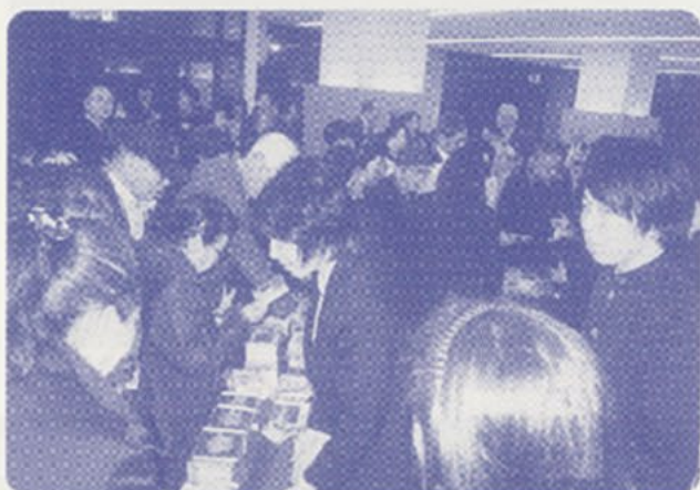
CDコーナーも盛況でした