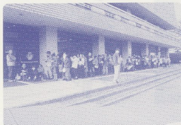
開場前には、もうこんなにお客様が並びました