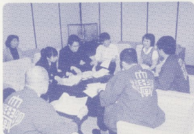
学生、エスポワール司会者との入念な打合せ