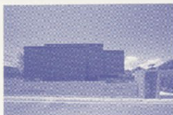
古森弘一氏の作品