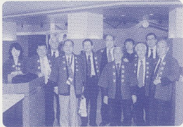
スタッフも集まってきました