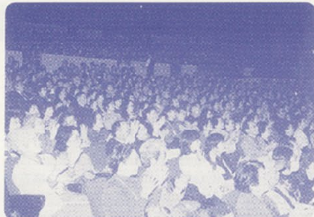
会場は割れんばかりの大拍手