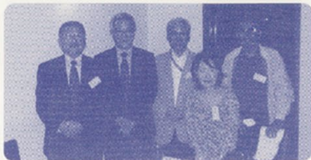
松本龍代議士（左から2人目）を囲んで