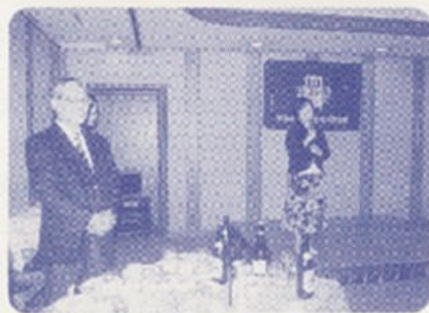
明大OGの奥様のご挨拶

が昭和24年、最終のシード権が昭和40年ということで、先生が部長に就任された頃はその衰退ぶりが著しかった。先生は年度事に目標を