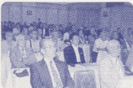
熱心に聞き入る満員の校友

ネルギッシュな話ぶりに我々は引き込まれていった。先生は商学部で松本ゼミを持たれているが、「教員生活の最初の10年間は体を張って教員をやった」というコメントに尋常でない情熱を感じた。その情熱を、当時弱体化していた競走部の復活に向けられたわけだ。