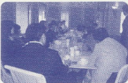
セミナー風景です

人生のゴールを百歳と見立て、幸せな人生を歩むために必要な、①健康 ②仲の良い家族・仲間・生きがい ③お金