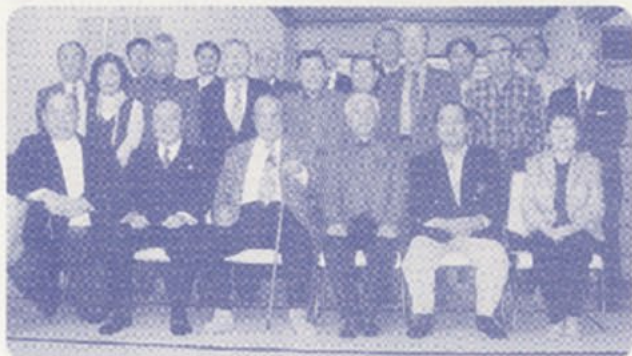
自己紹介や大学番付などの話で賑わいました

また、母校関連情報として「大学番付」（東洋経済10/22）の詳しい資料が配布され、石川遼君の明大入試のうわさ記事などの話題でも盛り上がり、母校の益々の発展振りに意を強くしたものでした。