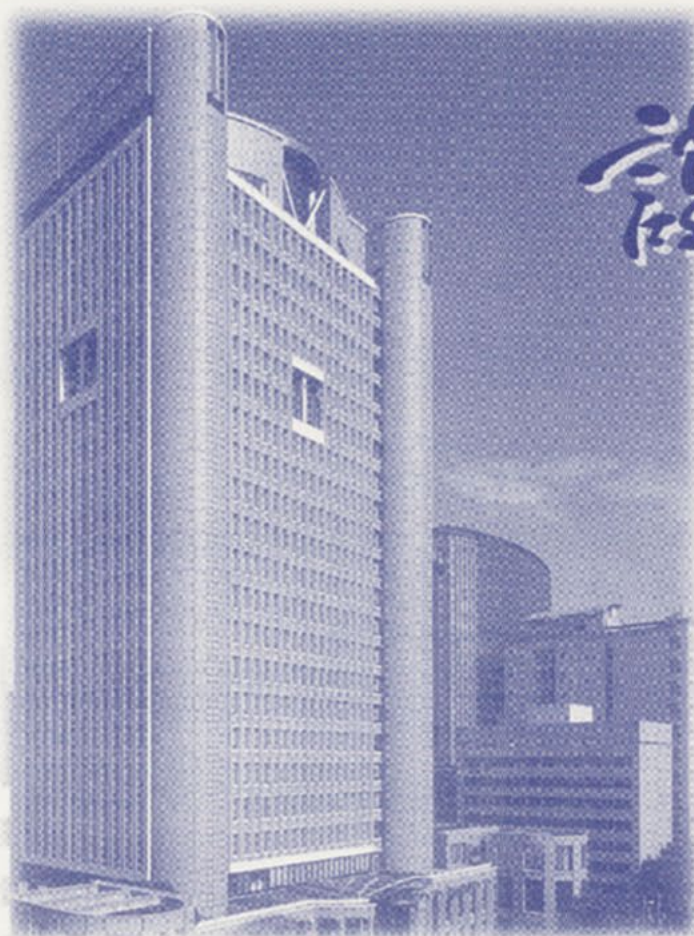
<リバティータワー>