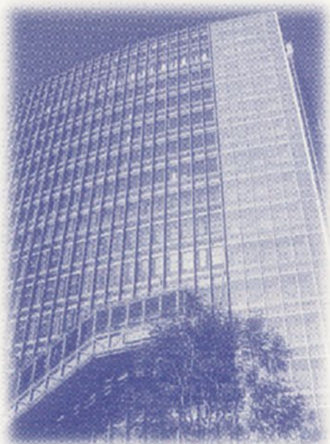
<アカデミーコモン駿河台校舎>