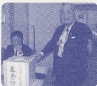
お元気だった古賀支部長も見舞金を

そこで、台湾の被害に少しでもお役に立てればという思いから、校友の方々に見舞金を募る事になりました。