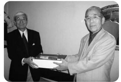
(左が内田校友、右が小石原校友)