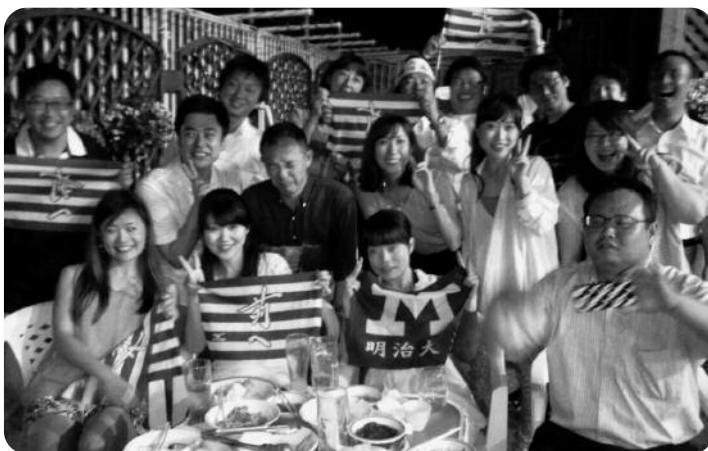
ビアガーデンにて