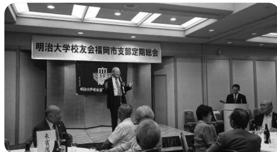
昨年の総会の様子

なお、周りにご案内が届いていないという校友がいらっしゃれば、お誘いの上、ご出席いただけますようお願いいたします。