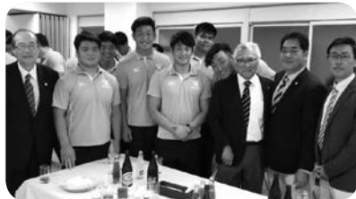
アフターマッチファンクション (向殿会長他&選手)

今年6月9日には大分でラグビー明早戦が開催されました。当日は天気も良く、会場も両校OBの他多くのラグビーファンで埋まっていました。明治OBは福岡、熊本、佐賀など隣県は当然ですが、遠くは関東からも応援にいられているとのことでした。大分開催の関係者の方々にもたくさんの話を聞くことができ、来年の北九州大会