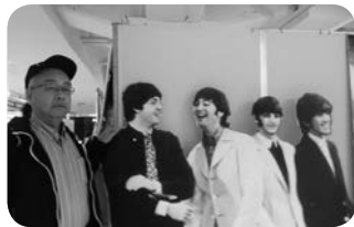
ビートルズと共に

私は熊本で生を受け高校時代まで過ごした。当時熊本県は国会議員（坂田道太・松野頼三・園田直の各大臣など）がすべて保守系であった。スポーツは柔道や剣道などの武道が盛んで、山下泰裕氏（柔道203連勝、ロス五輪金メダリスト、国民栄誉賞受賞、JOC新会長）らを輩出している。そんな保守的な県民性の中で育った私は、当時“不良が聴く”と言われていたザ・ビートルズ音楽を全く知らず、また触れる機会も皆無であった。