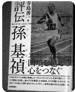
本の表紙 ベルリンオリンピックのマラソン優勝のシーン

孫 基禎は1912年、日本による植民地支配の北朝鮮新義州の貧しい家に生まれ、まともに学校にも通えない中で自分の能力を活かして走ることに専念し、数々のマラソン大会で優勝、世界記録を樹立し、ついに1936年第11回ベルリンオリンピックの男子マラソン競技で、日本代表として出場し金メダルを獲得したトップアスリートです。