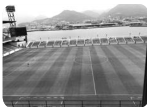
ミクニワールド スタジアム北九州

試合の会場となるのは「ミクニワールドスタジアム北九州」です。JR小倉駅からのアクセスも良く、徒歩7~8分でスタジアムに着きます。グラウンドとスタンドの距離も近く迫力あるプレーを観ることができ