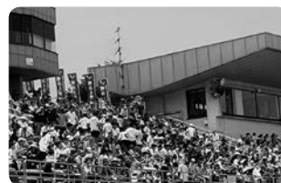
九州地区協議会の応援