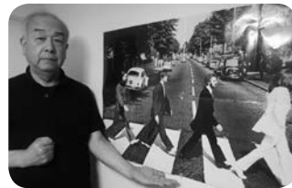
憧れのアビーロード

明大卒業後私は読売新聞社に入社したが、ビートルズの日本武道館公演を主催したのは偶然にも読売新聞社だった。当時正力松太郎氏は読売社主で武道館館長でもあった。昭和41年7月1日読売系の日テレがビートルズの日本武道館公演を放映し、高視聴率57%は現在でも特別番組の日本最高記録である。当時高校生の私は無論視聴していなかった（アメリカで初のビートルズTV出演時の視聴率は72%、その時間帯は犯罪都市ニューヨークでは青少年の犯罪がゼロだったという）。社会人の私は、社業が超多忙のためビートルズのことが入頭に入る余裕はなくなっていた。衝撃的な事件が起きたのはそんな時だった。1980年12月8日、ジョンが狂人に狙撃され即死した。40歳の若さだった。悲しみにふけっている暇はなかったが、その日はダークなネクタイをして出社したのを覚えている。