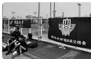
バックスタンドの福岡県父母会旗

試合は明大が29-14で早大に競り勝ち、校歌斉唱でフィフティーンの栄誉を称えました。