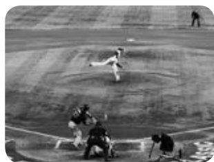
決勝戦大谷対トラウト最後の1球

3月16日(木)に行われた準々決勝で、侍ジャパンが1位通過でも2位通過でも、準決勝は米国時間の3月20日(月)ということが予め分かっていたので、日本チームと同じ便に搭乗したい願い、3月18日(土)のシカゴ便を予約していました。出発前には機内持ち込み荷物にサインペンとボールも入れ、機内でいつでもサインをもらえるように万全の体制を整えていました。というのも、ソフトバンクの選手と何度か福岡～羽田便で一緒になったことがあるのですが、全員が同じ便に乗ることはなく、何班かに分かれて移動しているので、今回も一番乗継ぎが便利なシカゴ便で、日本航空と全日空に分かれて乗ると見越していました。