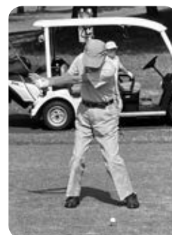
第一組目 大先輩方の力強いスイング