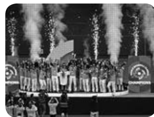
侍ジャパン表彰式

JTB米国支店で購入したチケットを当日ネットで受け取りました。準決勝キューバ対米国戦は1塁側キューバベンチの上で、目の前にはモイネロ、デスパイネ、グラシアルの姿もありました。準決勝のメキシコ戦は3塁側日本ベンチの上、そして決勝戦はバックネット裏という素晴らしい席でした。