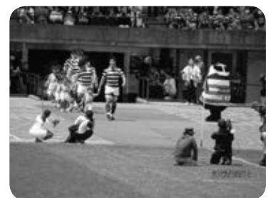
ラグビー姿のくまモンの歓迎

点は早稲田に取られたもののすぐに取り返しトライを重ね前半を終了。後半もほぼ明治ペースで進み、終わってみれば54-24で明治が